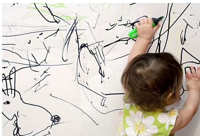
Каляки-маляки тоже рисование

Знакомства с карандашами и фломастерами можно обыграть играми «Спрячь картинку» и «Каляки-маляки». Для знакомства с красками — игры «Цветная вода», «Смешиваем краски», «Рисование на мокрой бумаге» и «Спрячь зверушку».