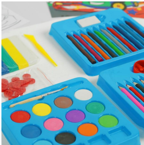
Материалы для рисования

Раздаточный материал для занятий по рисованию в младшей группе: бумага белая и тонированная;