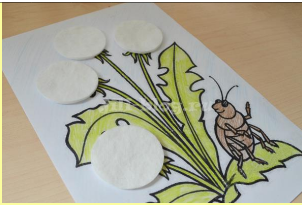
• Одуванчики из ватных дисков