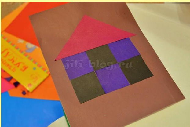
• Дом из блоков