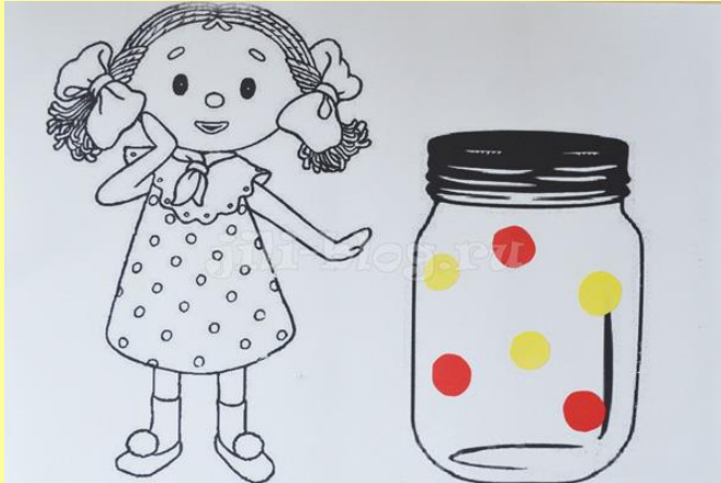
Витамины в баночке для девочки