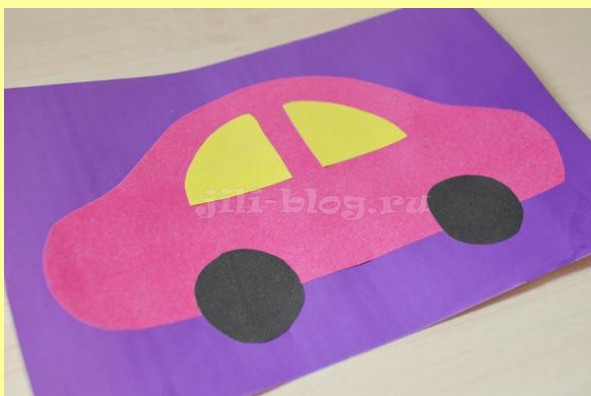
• Машина . К силуэту машины приклеиваем окошки, колеса, при желании — фары.