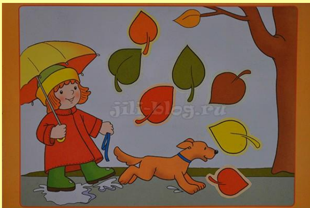
Осеннее дерево с падающими листиками. Идея аппликации из пособия « Это может ваш малыш. Наклей картинку ». Малыш наклеивает только падающие листья.