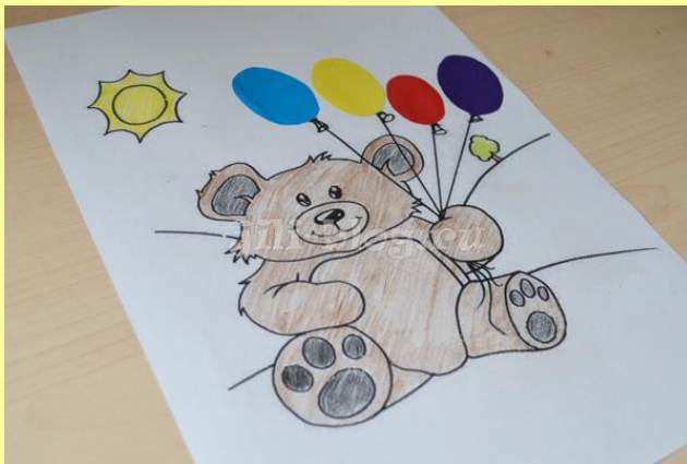
• Воздушные шары . Малыш приклеивает только воздушные шары к готовому рисунку.