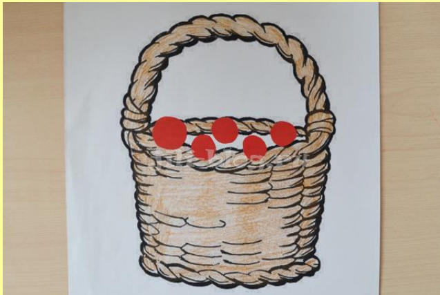
Ягоды в корзинке